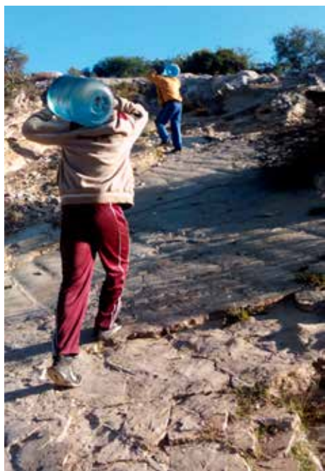
2. Acarreo a pie