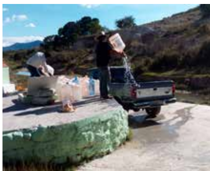
4. Acarreo en camioneta