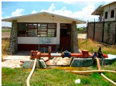
1. Red de abastecimiento