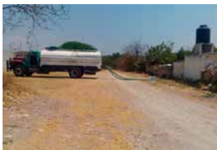
5. Compra de camión cisterna