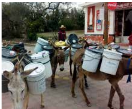
3. Acarreo en burro