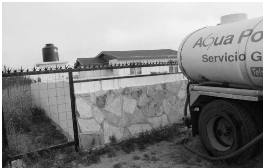
FOTOGRAFÍA 2. CISTERNAS PARA ACAPARAR AGUA

lo mismo: “pues vamos a decir que, póngale uno mil litros más o mil quinientos”. En la práctica, la cantidad de agua abastecida está condicionada al número y tipo de recipientes que dispone la población. Por ejemplo, entrevistamos a residentes que tienen un solo recipiente de 200 litros o menos y otros que tienen hasta cinco o más, que se trataban, en la mayoría de los casos, de Rotoplas. La persona que tiene un solo recipiente decía: “Sí, nomás ese tengo [...] No me alcanza [el agua] para la semana, se me va toda nomás en puro lavar y bañar. [Cuando se le acaba] tengo que ir allá a traerla [...], a la esquina, hay una llave, y hasta allá voy a traerla [...]” (L. Hernández, entrevista, 2015). Otros más tienen cisternas en las que acopian el agua que les reparte la pipa (véase la fotografía 2).