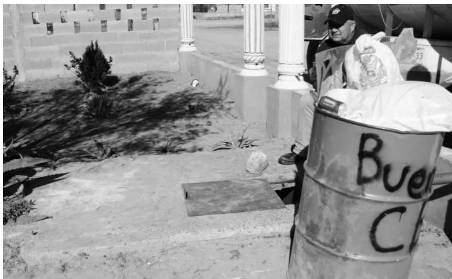
FOTOGRAFÍA 5. CESTO DE BASURA SOBRE LA CISTERNA

Esa problemática se observó en las viviendas. En algunos casos, las cisternas son de construcción rústica o carecen de un sistema apropiado de tapado. En una de las casas, incluso, se observó que los cestos de basura están sobre la tapa de la cisterna, lo que puede ocasionar la contaminación del agua por los posibles escurrimientos de los líquidos residuales de los desechos domésticos (véase la fotografía 5). En las visitas se constató que en ciertas viviendas el agua almacenada en los recipientes tenía ese color verdoso, tierra diluida o había mosquitos y muchos de los recipientes estaban sucios.